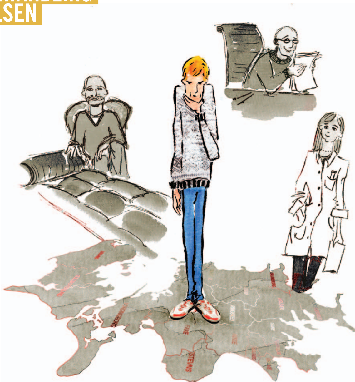
BEHANDLING EFTER UDSKRIVELSE

Navnet på den læge, der er ansvarlig for din behandling, når du er udskrevet, skal stå på dit udskrivningskort på side 2